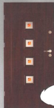
BASTION T-9 KWADRO

Grubość skrzydła: 45 mm Tłoczenie głębokie