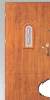
BARBAKAN T-3 LONDYN