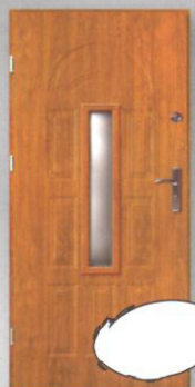
JOWISZ + 1xW3