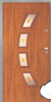
BASTION T-9 ARKUS