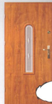
BARBAKAN T-3 LONDYN II