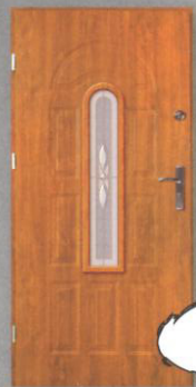
JOWISZ LONDYN II