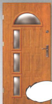
JOWISZ MADRYT + 3xW2