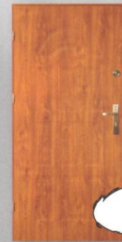
BARBAKAN T-3 pełne