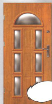
JOWISZ MADRYT + 6xW2

Grubość skrzydła: 40 mm Tłoczenie płyckie / gładkie