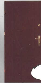
BARBAKAN T-6 pełne

Grubość skrzydła: 40 mm Tłoczenie płyckie / gładkie