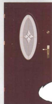
BARBAKAN T-6 OWAL