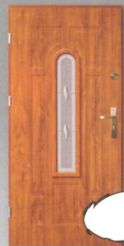
NEPTUN LONDYN II

Grubość skrzydła: 45 mm Tłoczenie głębokie