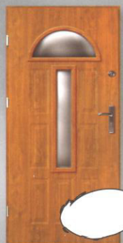
JOWISZ MADRYT + 1xW3