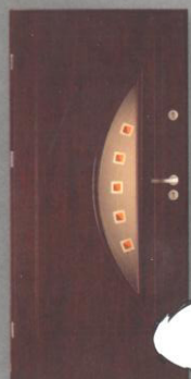
BASTION T-9 LUNA