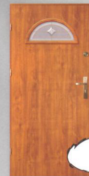
BARBAKAN T-3 MADRYT